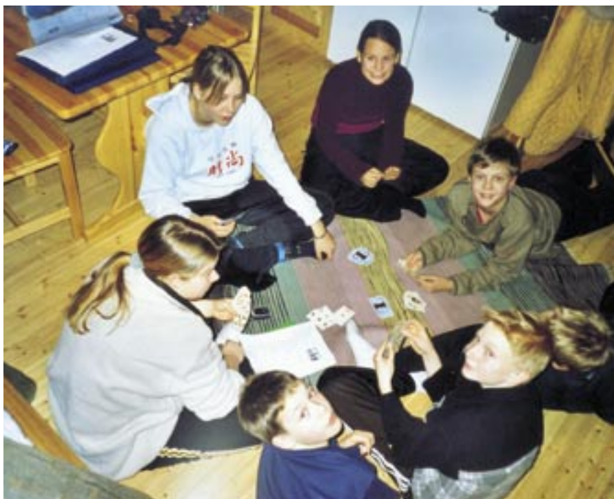
Kiilopään leirillä ehdittiin välillä rentoutuakin.