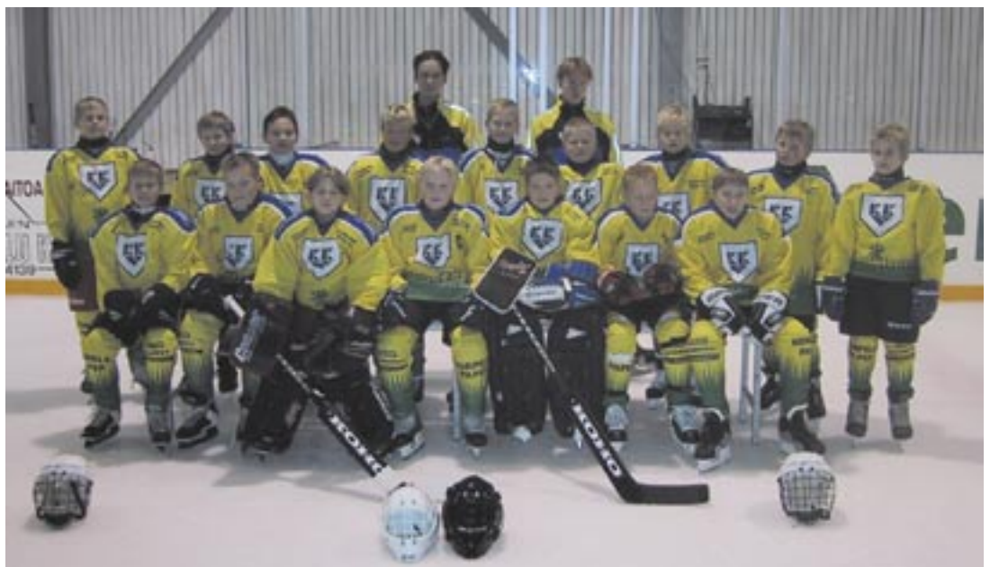
E-juniorit joukkuekuvassa en- nen kauden alkua.