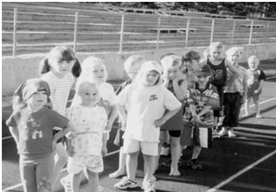
Kesä-Cupien nuorimpien sarjan innokkaita pituushyppääjiä valmistautumassa koirokseen

Perinteiset seuraottelut Vammalan Seudun Voiman, Lauttakylän Lujan ja KK-V:n kesken järjestettiin myös tänä vuonna. Tämä aikuisten ottelu on Suomen vanhin seuraottelu. Kisaillu on jo vuodesta 1930 ja ainoastaan vuosina 1937-40 ei kisoja pi-