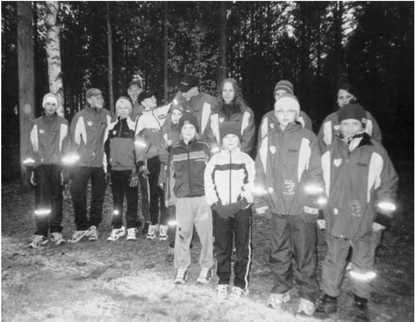
KK-V:n hiihtäjät nähdään talvella uusissa seuravärisissä lämmittelypuvuissa. Kuten kuvassa näkyy hihansuussa ja puntissa loistaa heijastinnauhat.