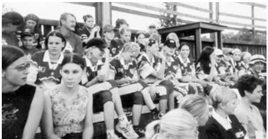
Jyväskylän valtakunnan leirillä. Sinikeltaiset KK-V:n värit palkittiin tyttöjoukkueissa Reilun-Pelin Joukkueena.