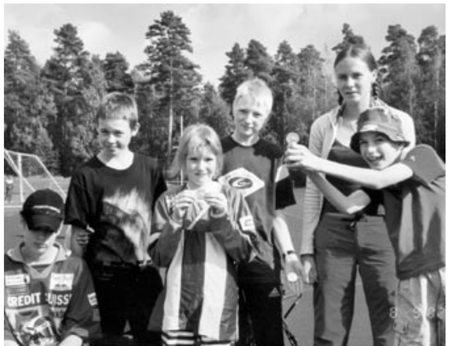
Kuvassa osa nuorista jotka osallistuivat kesällä kahdeksan osakilpailua käsitteävään Orava-Cupiin. Viimeisen osakilpailun jälkeen on helppo hymyillä ja esitellä mitaleja ja plaketteja.