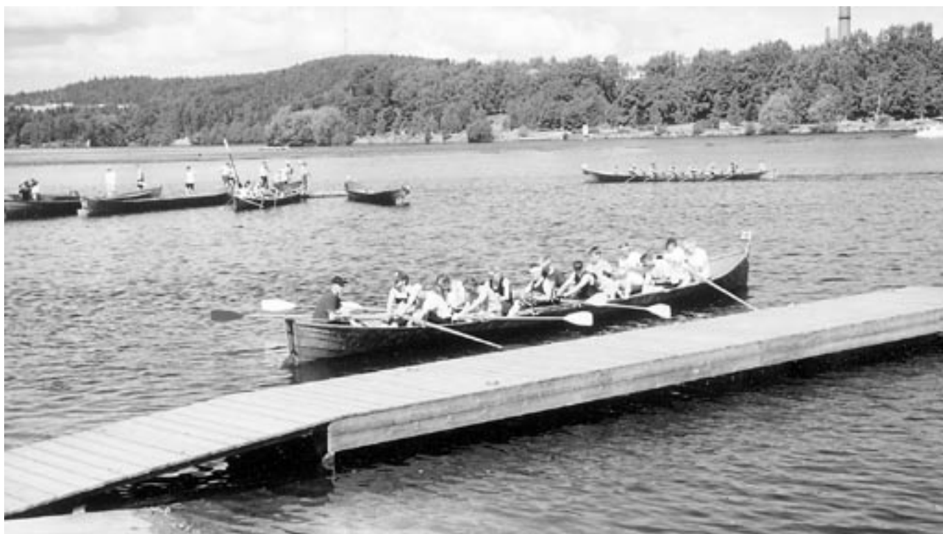
Vene lähdössä voittoisaan soutuun.

Vielä uutena tuli, syksyllä loka- kuussa, mukaan Jämin hiihtoputki. Ensivaikutelma oli erittäin hyvä. Ajomatkan ollessa kohtuullinen, noin 2,5 tuntia edestakaisin, voi siel- lä käydä 1-2 kertaa/vk. Tämä moti- voi hiihtäjää aivan eri tavalla kuin