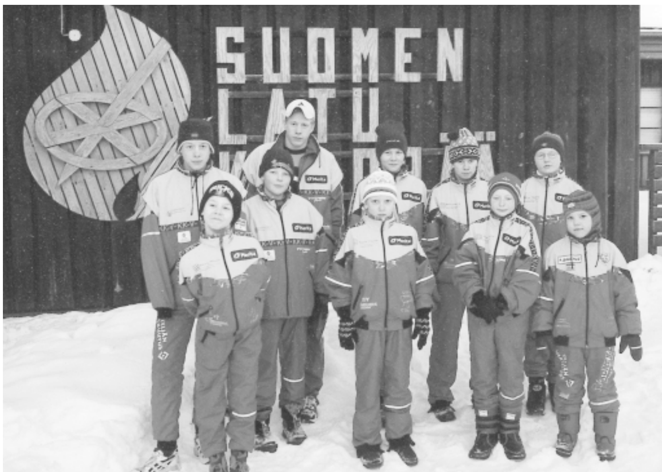
Nuoria hiihtäjälupauksia viime talven lumileiriltä Lapin tuntureilta.

Sisältää ohjatun toiminnan, vakuutuksen ja pipon.