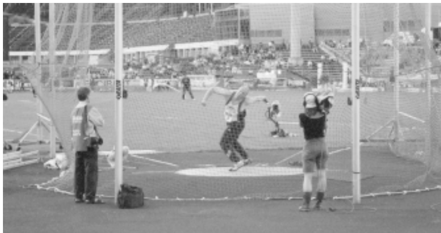
Tästä lähtee 54.56 Kalevan kisoissa Lahdessa.

Ikaalisten jälkeen aloitin toisen harjoitusjakson, jonka tähtäimenä olivat Kalevan kisat. Kaikki suunnitelmat romuttuivat kuitenkin heinäkuun 18. päivä Pitkäjärven kisoissa, kun ensimmäisessä heitossa sain nivusrevähtymän. Kesän loppu olikin heittämisen osalta yhtä tuskaa. Piirimestaruuden voitin varovaisilla heitoilla loistavissa olosuhteissa Vammalassa tuloksella 54.08. Kalevan kisoissa heitin särkylääkkeiden avulla karsinnasta rennosti finaaliin, mutta siellä ei tekniikka kestänyt aivan täysivauhtisia heittoja, joita olisi menestymiseen vaadittu. Tulos 54.56 ja 9. sija olivat aivan muuta, mitä olin edellise-